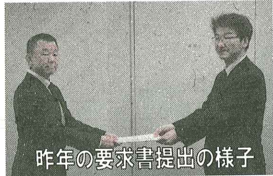
昨年の要求書提出の様子