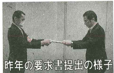
昨年の要求書提出の様子

本日3月7日、現業職員協議会においても、15 課題 44 項目にわたる「2025 春季要求書」を知事に提出します。『賃金水準の改善』及び『原則退職不補充を見直し正規職員採用を行うこと』を強く求めます。